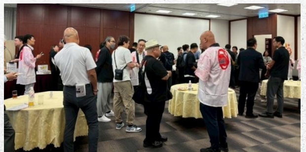
商务交流会的情景

展会前一天的13日（周三）晚7点起，我们在“香港日本人俱乐部”举行了一场展前商务交流会，邀请了当地买家等人士参加。经过一家在食品流通领域拥有丰富经验的当地合作伙伴公司精心挑选，共有来自24家公司的41位买家出席交流会。买家们不仅可以品尝餐桌上展示的各家公司商品，还能在轻松愉快的氛围中，进行活跃的商务洽谈和信息交流。