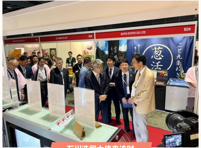
石川浩司大使来访时

石川浩司大使在展会首日莅临展位。展会期间，6家参展企业的公关人员及秘书处工作人员持续派发宣传册，推广日本产食用肉加工品的魅力和特点，并提供6家参展企业的商品试吃，展会每天都吸引了大量来访者。1000多人参与了品尝后的问卷调查，其中90%以上的受访者对所有商品给出了“非常美味”或“美味”的评价。结果显示，超过90%的受访者对日本产食用肉加工品的印象为“良好”，而超过80%的受访者认为原因在于“高品质”。此外，当被问及未来是否愿意经销或采购日本产肉食用肉加工品时，超过70%的受访者表示“想增加经销量”或“视价格有可能增加经销量”，展现出浓厚的兴趣。这些反馈表明，日本产食用肉加工品在新加坡市场具备巨大的潜力。