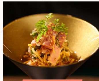
宣传照片④ 里脊火腿