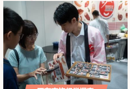
正在实施问卷调查