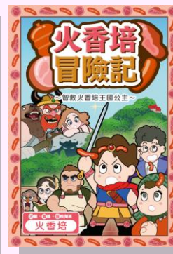
派發小冊子（繁體字版）