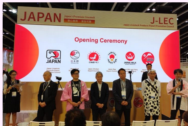
協議會的 6 位代表登台致意

食用肉加工品出口協議會成立於 2021 年 2 月 1 日，自創建以來，協議會仿效更早成立的其他品類協議會的做法，創建了統一的標識，註冊了商標，並製作了普及商品的宣傳冊。自去年以來，我們主要參加海外展會，目前正計劃全面拓展出口市場，擴大出口規模。2024 年香港美食商貿博覽是我們第四次參加海外展會。眾多參展商和訪客前來，本攤位也人氣空前。