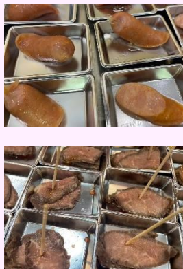
提供品尝的商品 (例)