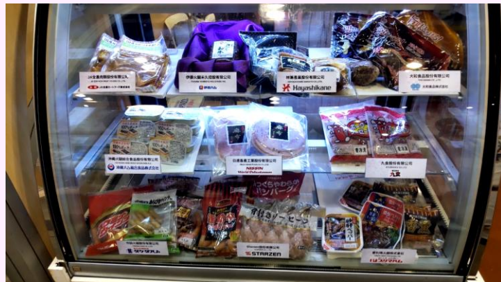
展示商品 (10 家企业)

近 200 人参加品尝后回答了问卷调查，其中 70% 以上的受访者给出了“非常满意”或“满意”的评价。另外，问卷中还问到对日本产食用肉加工品的印象，超过 80% 的受访者回答“高品质”“外观富于吸引力”“安全且值得信赖”。由此可见，日本产食用肉加工品在香港深受信赖。