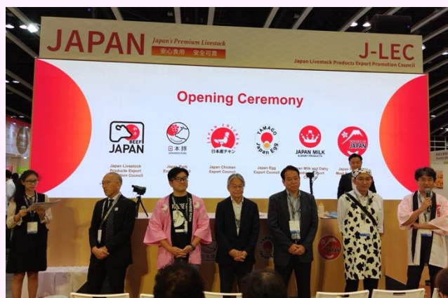
协议会的 6 位代表登台致意

食用肉加工品出口协议会成立于 2021 年 2 月 1 日，自创建以来，协议会效仿更早成立的其他品类协议会的做法，创建了统一的标识，注册了商标，并制作了普及商品的宣传册。自去年以来，我们主要参加海外展会，目前正计划全面拓展出口市场，扩大出口规模。2024 年香港美食商贸博览是我们第四次参加海外展会。众多参展商和来访者前来，本展位也人气空前。