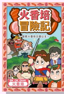
派发小册子 (繁体字版)