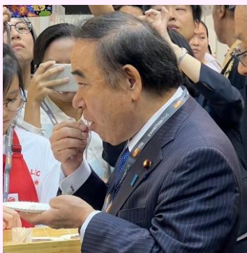
坂本农林水产大臣

农林水产大臣坂本哲志作为日本政府代表出席了日本馆的开幕式，随后，他也参观了所有日本的展位。