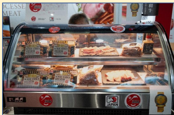
食用肉加工品的展示

日本畜產品出口促進協會食用肉加工品出口部會（原名）成立於 2021 年 2 月 1 日，自創建以來，出口部會仿效更早成立的其他品類協議會的做法，創建了統一的標識，註冊了商標，並製作了普及商品的宣傳冊。出口部會已經制定計劃，從本年度起，將積極參加以海外為主的國際展會，為開拓出口市場和增加出口而全面開展活動，本次台北國際食品展覽會 2023 正是首次嘗試。也因為這次是新冠疫情後久違的現場活動，本攤位十分熱鬧。