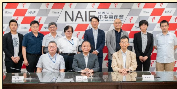
在台灣中央畜產會