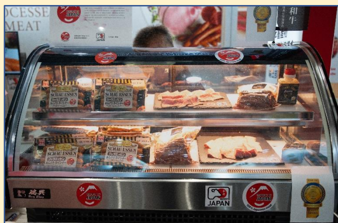
食用肉加工品的展示

日本畜产品出口促进协会食用肉加工品出口部会（原名）成立于 2021 年 2 月 1 日，自创建以来，出口部会效仿更早成立的其他品类协议会的做法，创建了统一的标识，注册了商标，并制作了普及商品的宣传册。出口部会已经制定计划，从本年度起，将积极参加以海外为主的国际展会，为开拓出口市场和增加出口而全面开展活动，本次台北国际食品展览会 2023 正是首次尝试。也因为这次是新冠疫情后久违的现场活动，本展位十分热闹。