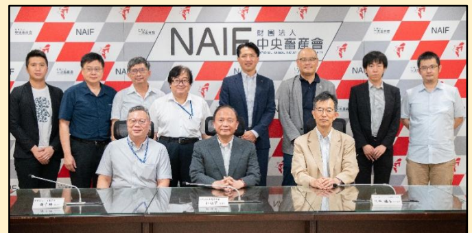
在台湾中央畜产会